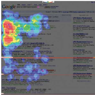
Eyetracking Heatmap: How Searchers View the Google One Box

Uit the Marketing Sherpa report excerpt: Het rode gebied is waar de gebruikers als eerste kijken en bij veranderende kleuren neemt de aandacht af. De X-en laten het clickgedrag zien en de rode lijn laat zien tot waar gebruikers scrollen.